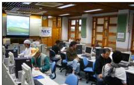
NECとともにいったIT研修講座

09年3月、農林水産省の農村活性化人材育成派遣モデル事業“田舎で働き隊！”プログラムに3名が参加。2泊3日の農業研修でジャガイモの植えや畑の草むしり、ビニールハウスでの水やりなどを体験しました。さらに、5月には、NPO法人「森の蘇り」の協力を得て、11名が林業体験に参加。手で樹皮をむく省力的な間伐手法である“皮むき間伐”を体験し、森林保全についても学びました。