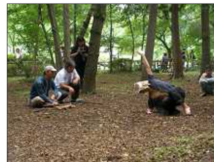
森の中でおどるソケリッサ

その他にも、当事者が企画し、市民とともに大阪の街を歩く「歩こう会」や、卓球クラブ、ヨガ、映画鑑賞会など、多くの人気が気軽に参加できるように、多様なクラブ活動を行いました。