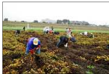
むかご収穫バスツアー

保証人不要の低家賃住宅を支援者などよりご提供いただき、9名の方がアパートに入ることができました。入居後も継続して家賃を払い続けていくため、金銭管理のサポートなども行っています。