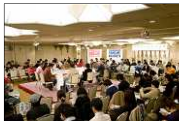
大阪ホームレス会議

『路上脱出ガイド』の配布後、福祉相談が増え始めたため、独自に対応する体制を整えつつあります。相談者は、大阪で7名、東京で15名。生活保護申請書の書き方をレクチャーしたり、申請に同行したりしました。