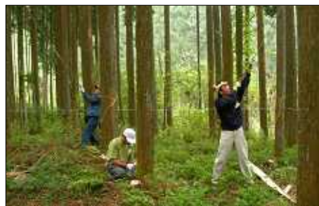
皮むき間伐を行った林業体験