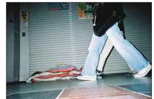
「大阪“路上”の風景」よりHさん撮影