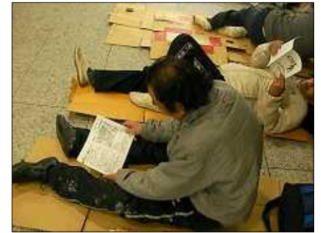
路上脱出ガイドを受け取る当事者

「つい最近まで生活保護をもらい寮に住んでいましたが、環境に馴染めず寮を出ました。後悔していましたが、ガイドを見るまで生活保護の申請は一度しかできないものかと思っていました。何度でも申請できることを知り、もう一度チャレンジしてみようと思います」